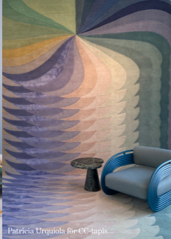
Patricia Urquiola för CC-tapis